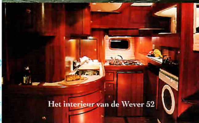
Het interieur van de Wever 52

dat u bang hoeft te zijn dat de geïnves- teerde f 1,2 miljoen onmiddellijk onder water verdwijnt. Ook kan het schip met opgetrokken kiel droogval- len op het wad of in een getijhaven, zoals we die aan de Engelse en Franse kusten vaak aantreffen.